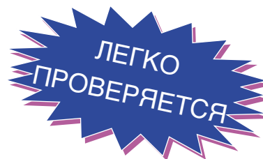
Таблица кодов неисправностей

Примечание: Пуск осуществляется с задержкой в 40 секунд.